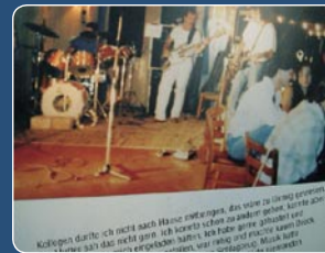
Kiddepin darfto ich nicht durch Bäume zwafangen, das wate da lunge sprachen nicht gute, ich schnell schen zuwider gehen, keine dort ich Fude gute Altwedel und einige haben, wie mich und nichte kann Druck einige haben, wie mich und nichte kann Druck