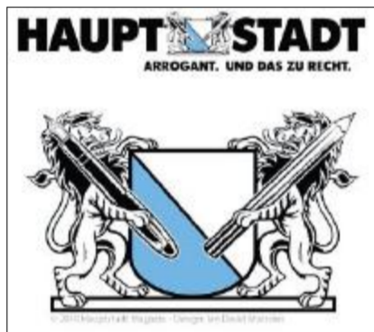
Im neuen Titellogo der «Hauptstadt» wurden die Löwen verändert.

Die Jugendlichen im Kanton Zürich sind aufgerufen, sich Projekte auszudenken, die etwas im öffentlichen Raum verändern und sich positiv auf das Gemeinwesen auswirken. Bis Ende November können sie sich beim Projektwettbewerb «Projekter» anmelden. Initiiert wird dieser von okay Zürich und der Stiftung Mercator Schweiz. Konkret sucht «Projekter» Vorhaben, die von Jugendlichen zwischen 12 und 15 Jahren selbstständig initiiert, geplant und bis Ende des Jahres umgesetzt werden. Diese können unter www.projekter.ch angemeldet werden. Im Januar 2011 werden die besten ausgezeichnet. Die Sieger teilen sich eine Gesamtsumme von 8000 Franken. (sda)