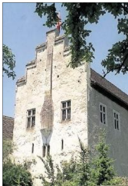
Die besterhaltene Johanniterkomturei Europas: das Ritterhaus in Bubikon. (key)

Zwischen Rüti und Bubikon verkehrt während des ganzen Tages ein Shuttlebus: passend zum Tag des Denkmals ein Saurer-Oldtimerbus aus dem Jahr 1926. Nähere Informationen zum Programm gibt es im Internet unter www.denkmalpflege.zh.ch . Das schweizerische Gesamtprogramm findet sich unter www.hereinspaziert.ch . (sda)