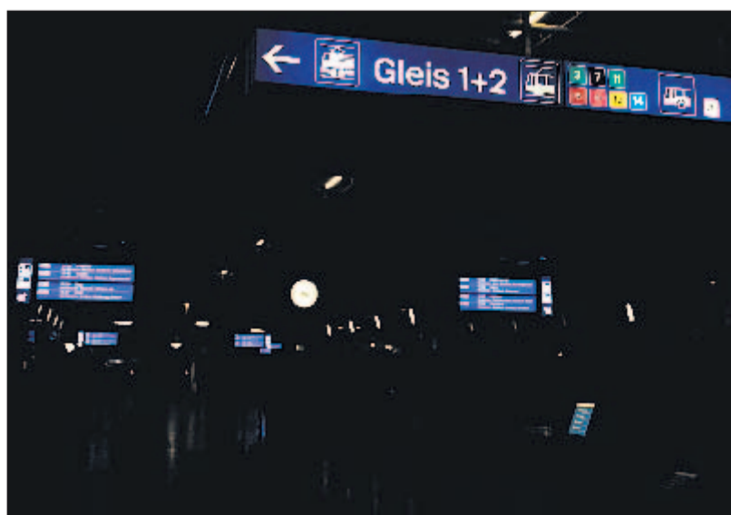
Orientierung erschwert: der Hauptbahnhof Zürich am Mittwochnachmittag.

Stück zu finden und zu reparieren. «Die meisten Kurzschlüsse sind auf Bauarbeiten zurückzuführen», sagte Graf. Auch die Grossbaustelle im Hauptbahnhof sei während der Panne ohne Stromversorgung gewesen. Im Hauptbahnhof waren während des zweistündigen Blackouts Kundenbetreuer der SBB im Einsatz, um den zahlreichen, verwirrt herumstehenden Passagieren zu helfen. (sda/zl)